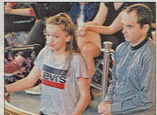
Deux « vrais faux » procès ont été joués au collège Gassendi de Rocbaron.